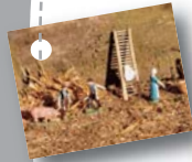
Planche Produits de la ferme

1 Quelque chose se prépare. Que va-t-il se passer ? Dans quelle intention ?