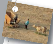
Planche La basse-cour

1 Devant le petit cochon qu'il rencontre, le dindon gonfle ses plumes, comment nomme-t-on cette action ? Et cette sorte de crête qui pend à côté de son bec ?